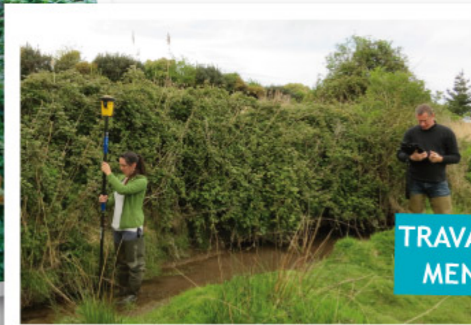
TRAVAIL CARTOGRAPHIQUE MENÉ PAR LE SYNDICAT