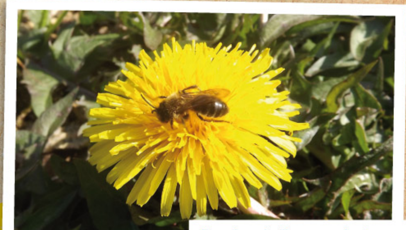
Pour les abeilles, ces plantes sont tout sauf des mauvaises herbes.

Face au développement de ces plantes adventices, le modèle du gazon uniformément vert orientait souvent vers la lutte chimique, jadis. La place prépondérante aujourd'hui accordée aux enjeux du développement durable conduit désormais à recourir à d'autres méthodes : désherbage manuel, opérations mécaniques, fertilisation et amendements adaptés.