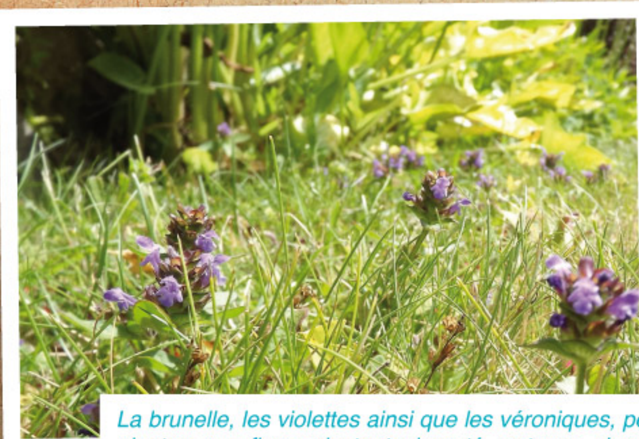
La brunelle, les violettes ainsi que les véroniques, petites plantes aux fleurs de toute beauté, ont une singulière capacité à panacher le vert du gazon de leurs pétales déclinant toutes les nuances de bleu, mauve, violet.

Toile de fond du jardin, le gazon structure ce micro-paysage dessiné par les parterres, haies, allées... Généralement composé exclusivement de graminées lors du semis, il s'enrichit progressivement d'autres plantes qui sont elles-mêmes le support d'une plus grande diversité biologique.