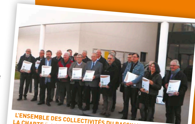
L'ENSEMBLE DES COLLECTIVITÉS DU BASSIN VERSANT A SIGNÉ LA CHARTE (ici, Lannion-Trégor Communauté et les communes de son territoire situées sur le bassin versant)

Pour chacun de ces sujets, les collectivités signataires s'engagent à tendre vers les pratiques les moins impactantes pour la qualité de l'eau et des milieux aquatiques.