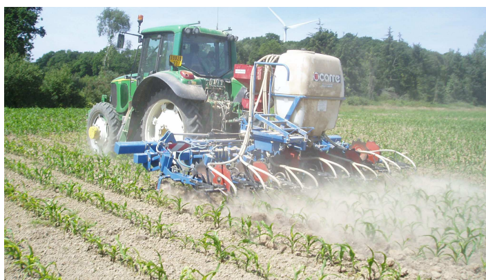
Semis de RGI avec binage

ATTENTION! Ne pas désherber le maïs avec un produit de prélevée : produit phytotoxique pour le ray grass.