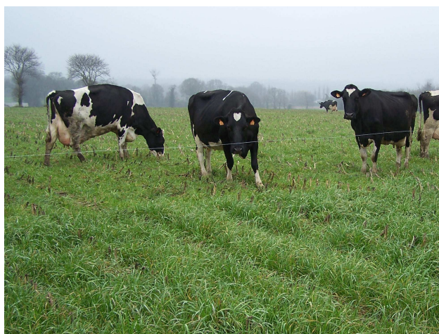
Valorisation du RGI par pâturage

Un chantier collectif de semis de Ray Grass sous couvert de maïs est proposé à l'ensemble des agriculteurs du bassin versant.