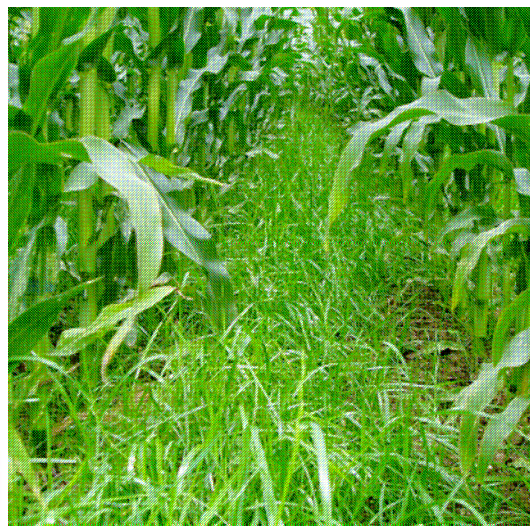
RGI sous maïs – Le Foeil –29/08/12

Quelles sont les conditions de réussite, les problèmes rencontrés ?